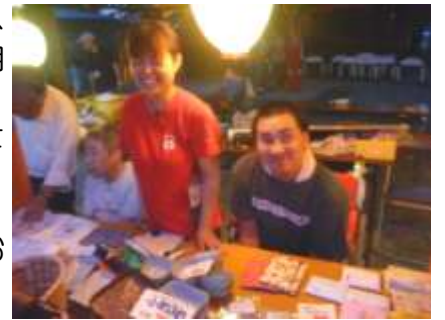
↑作業班では販売もさせていただきました！