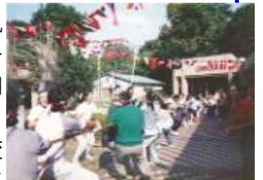
まだ門構えがあった 平成4年運動会の様子

また地域の方をディサービスで受け入れ、最近では日に30名近くの方が利用されるようになり、設備的に手狭となったため、23年度上半期を目標に分場の開設も予定しています。今後も様々なニーズに対応できる施設を目指し、地域の方々の協力を得ることで更に発展して行きたいと思えます。